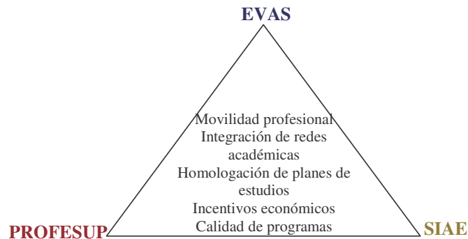
Figura 2. Esquema de GRANA

El proceso de EVAS considera al PROFEESUP y al SIAE, es decir, para dar seguimiento a la acreditación de un programa educativo es necesario que los participantes reciban una capacitación para que entiendan el proceso de evaluación en el contexto internacional y se familiaricen con el Sistema de Acreditación y Evaluación en línea.